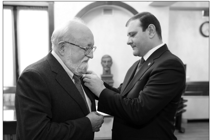
Մէր Երեւան ղադրժլ Կիւիտօք Սենժերցեկօք շօղօմ ղադրժլ Մէր Երեւան