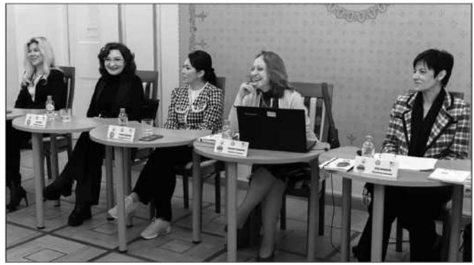
Саммит Содружества, 23-27 апреля, 2023 Commonwealth Summit, April 23-27, 2023 Համագործակցության համաժողով, 23-27 ապրիլի, 2023 թ.