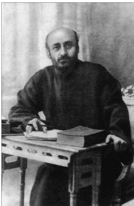
Կոմիտաս, 1910թ. Комитас, 1910. Komitas, 1910.