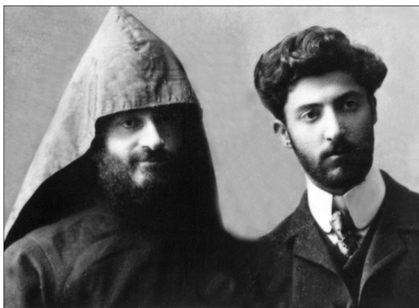
* Կոմիտասը և Վ.Տեր-Արաքելյանը, Բաքու, 1908թ. Комитас и В.Тер-Аракелян, Баку, 1908. Komitas and V.Ter-Araqelyan, Baku, 1908.

դապարճաններից մեկն էլ հանդիսացավ Խրիմյան Հայրիկի կորուստը (1907թ.):