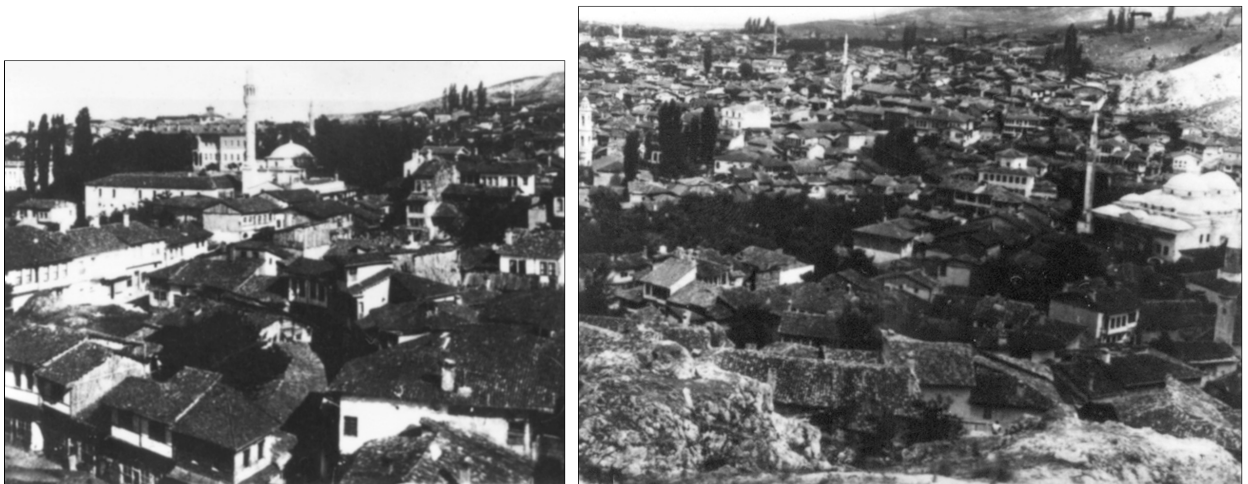
* Սողոմոն Սողոմոնյանի ծննդավայրը՝ Քեոթախիա (Արևմտյան Հայաստան) Кутина (Западная Армения). Место рождения Согомона Согомоняна. Soghomon Soghomonyan's birthplace Kiotaia (Western Armenia).