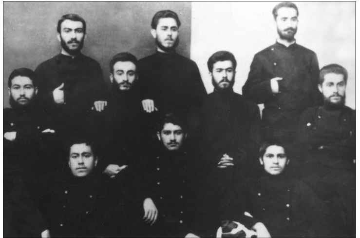
* Ճեմարանականներ, 1892-1893թթ. Семинаристы, 1892-1893. Seminarium students, 1892-1893

Կոմիտաս Վարդապետի առաջադեմ գաղափարները դժգոհություն էին առաջ քերում ճեմարանի կղերական շրջաններում: Էջմիածնում Վարդապետի սրբեղծագործական վերելքը կասեցնող դր-