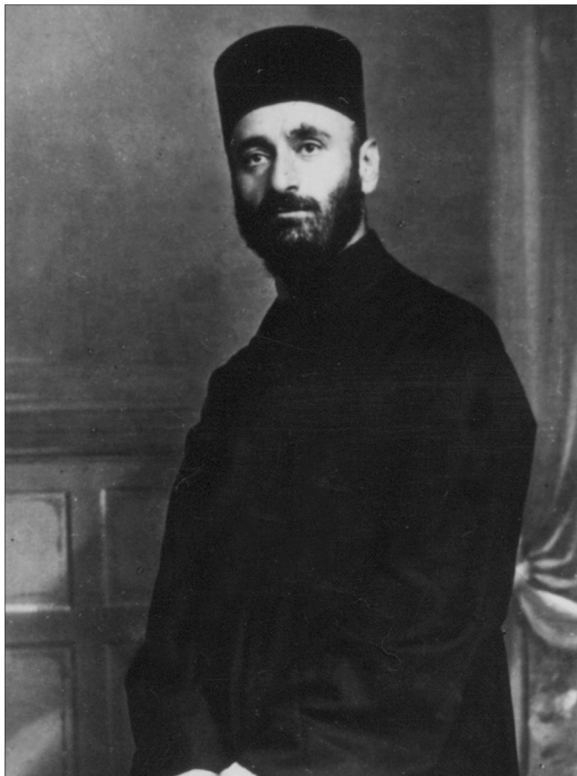
* Կոմիտաս Վարդապետ, Կահիրե, 1911թ. Архимандрит Комитас, Каир, 1911. Komitas Vardapet, Kahire, 1911