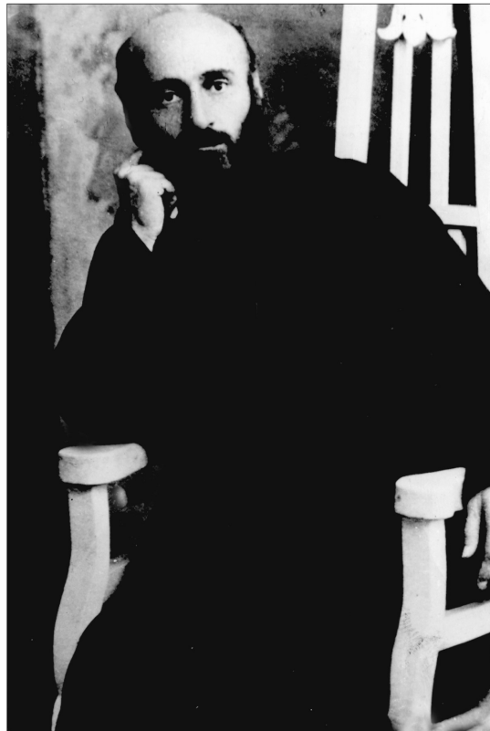
* Կոմիտաս Վարդապետ, Բերա, 1913թ. Архимандрит Комитас, Бера, 1913. Komitas Vardapet, Bera, 1913.