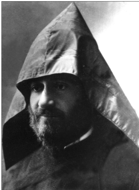
* Կոմիտաս Վարդապետ, Բաքու, 1908թ. Архимандрит Комитас, Баку, 1908. Komitas Vardapet, Baku, 1908.