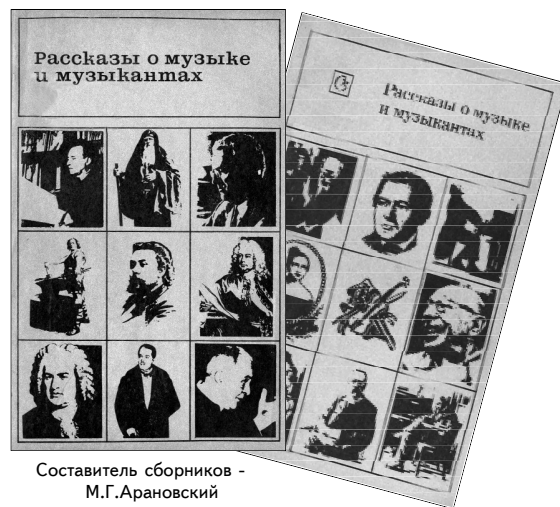
Составитель сборников - М.Г.Арановский