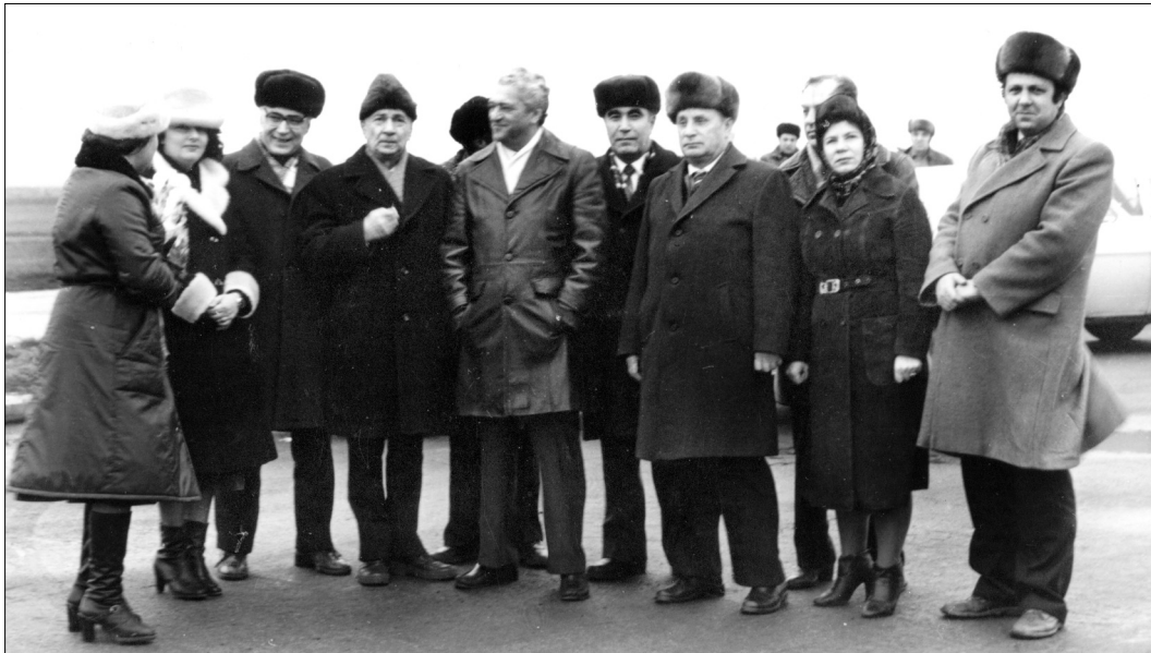
Группа работников культуры Париж, 1976 г.

дании, а оценивают только результат. Но если чуть подняться над происходящим, можно увидеть мастера–творца, перед которым возвышается библейская гора, а позади, как надежное прикрытие, стоит сын. И каждый взмах кисти обретает первозданную мощь! В папе было поразительное сочетание идеала и нормы. Иначе трудно представить, что при великом отце он состоялся как высокопрофессиональный музыкант и как человек неповторимой индивидуальности. Пройдя через испытания войны, он остался добрым, мягким и чутким. Это не мешало ему возглавлять на протяжении почти четверти века такой очаг музыкальной культуры, как консерватория. Разлетевшиеся со временем по всем странам и континентам ее выпускники, называют этот период “золотым временем”. В этом определении не только оценка полученных профессиональных достижений, но особое отношение к атмосфере,